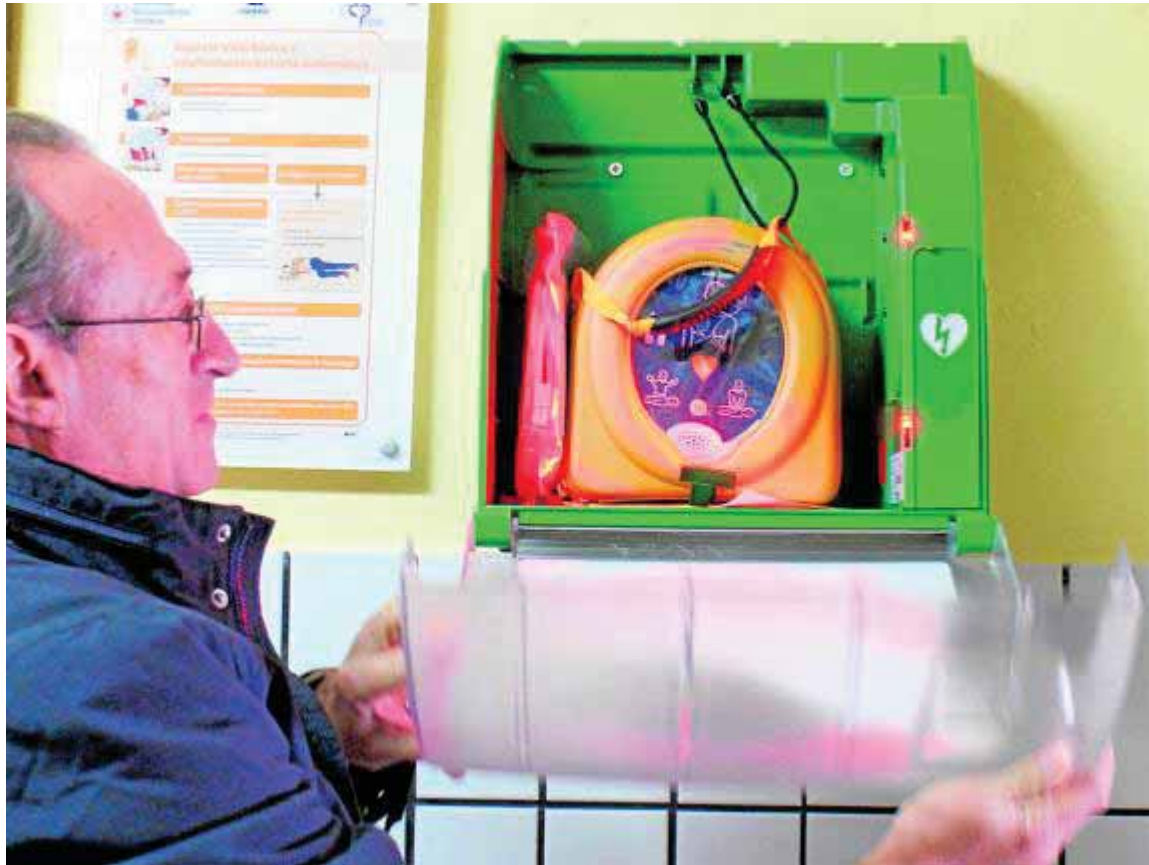
Desfibrilador del campo municipal de fútbol de Albolote.

Así es. El decreto 22/2012 de 14 de febrero de la Junta de Andalu-